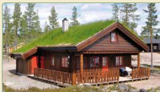
FH 81 Osen Utvidet 1.449.000,- *