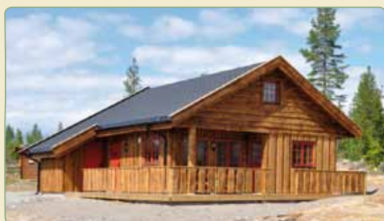
FH 63 Bjørnebu 1.299.000,- *