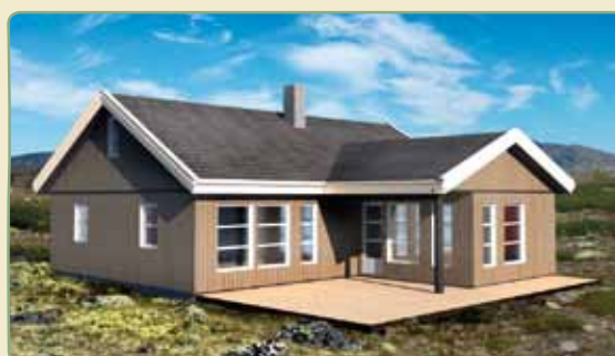
FH 101 Gaustadblick 1.724.000,- *