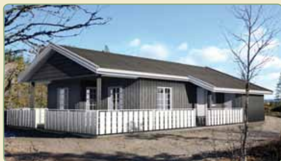
FH 75 Veslefjell 1.349.000,- *